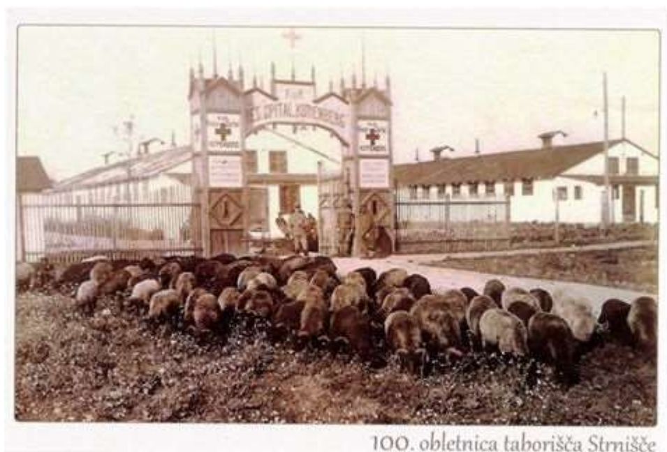
100. obletnica taborišča Strnišče

Glede na materialne pogoje šole in zastopanost teme v kraju in okolici bomo izbrali dva tematska sklopa izmed štirih, ki jih bomo obravnavali v 35 učnih urah. Del učnih ur se bo izvedel tudi v obliki terenskega dela.